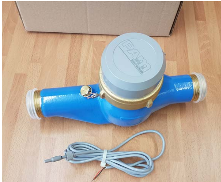
1. Poista muovinen suojatulppa