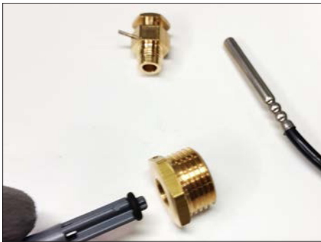
Asenna sovitekappale putkistoon ja sen jälkeen o-renkas sovitekappaleeseen.