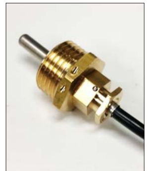
Kiristä anturipidike sovitekappaleeseen (maks. 12 Nm). Varmista liitosten tiiviys.