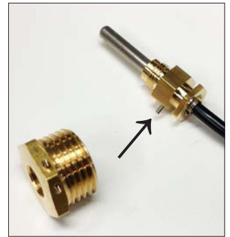
Paina lukitustappia hieman sisään samalla tunnustellen, että tappi osuu anturissa olevaan uraan.