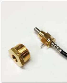
Pujota lämpötila-anturi anturipidikkeeseen.