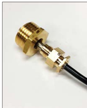
Pujota anturi sovitekappaleessa olevan o-renkaan läpi.