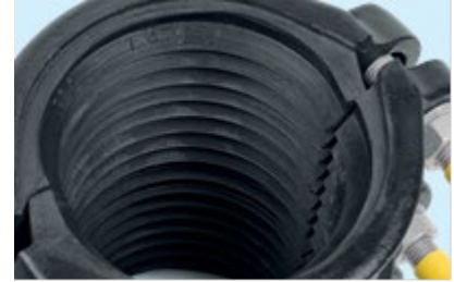
Sakaraprofiilinen kumitiiviste mahdollistaa vuodon parhaan kapseloinnin ja pysyvän korjauksen

Kolmiosainen korjausmuhvin toleranssialueet ovat laajat, kattaen useiden putkien ulkohalkaisijat kyseisellä nimellishalkaisijalla (DN). Varastoinnin tarve vähenee laajan toleranssialueen johdosta.