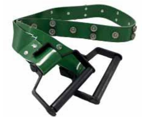
Tuotenro S7010 127